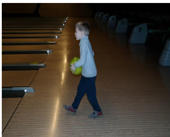
Jong geleerd is oud gedaan