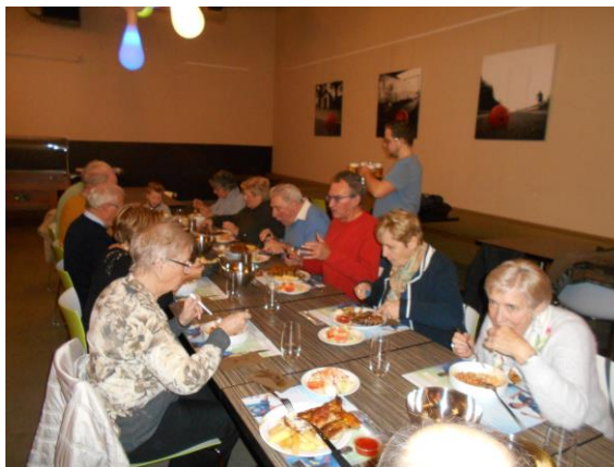
DE CULINAIRE AFSLUITER